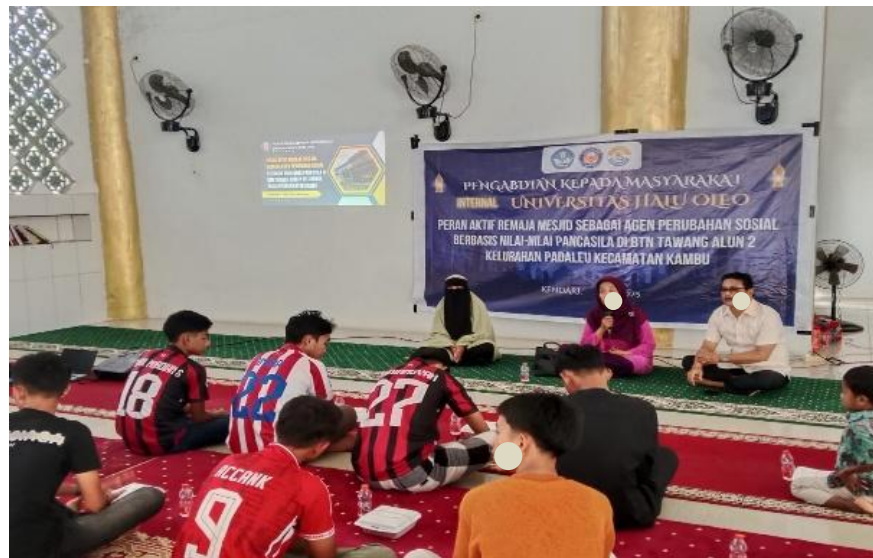
Gambar 1. Pelaksanaan Workshop dan Diskusi Remaja Masjid

Berdasarkan hasil evaluasi pascakegiatan, capaian program dapat dilihat pada aspek pemahaman nilai-nilai Pancasila, persepsi terhadap kualitas materi, dan relevansi pelatihan terhadap kebutuhan organisasi remaja masjid. Data kuesioner dari 21 responden menunjukkan bahwa sebanyak 76,2% peserta menyatakan materi tentang internalisasi nilai-nilai Pancasila sangat bermanfaat dan 23,8% menyatakan bermanfaat. Pada butir kejelasan pemateri dalam menjelaskan peran strategis remaja masjid sebagai agen perubahan sosial, 81% responden memberikan penilaian sangat bermanfaat dan 19% bermanfaat. Sementara itu, pada butir mengenai relevansi materi pelatihan perancangan program kerja, 90,5% responden menyatakan sangat bermanfaat dan 9,5% menyatakan bermanfaat. Data tersebut menunjukkan bahwa peserta menerima kegiatan secara sangat positif dan menilai bahwa materi yang diberikan sesuai dengan kebutuhan nyata organisasi remaja masjid. Secara lebih mendalam, temuan ini juga mengindikasikan bahwa persoalan utama mitra bukan sekadar kurangnya pengetahuan normatif, tetapi juga keterbatasan dalam menghubungkan nilai dengan kebutuhan praksis organisasi.