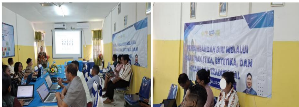
Gambar 1. Pelaksanaan pelatihan daring/luring pengembangan diri bagi PMI di Dili, Timor Leste

Tahap pelaksanaan dilakukan melalui dua sesi daring dan satu sesi luring. Pada sesi daring pertama, tim pengabdian menyampaikan materi tentang etika sosial, etika komunikasi, dan pentingnya perilaku santun dalam interaksi lintas budaya. Pada sesi daring kedua, materi difokuskan pada estetika berpenampilan, termasuk etika berbusana, berhias, serta sikap tubuh seperti cara berdiri, duduk, dan berjalan yang baik dalam konteks formal maupun sosial. Sementara itu, sesi luring dipusatkan pada praktik langsung, baik praktik penampilan diri maupun olahraga tradisional Indonesia. Kegiatan luring memberi kesempatan kepada peserta untuk mengalami proses belajar secara lebih konkret melalui simulasi, demonstrasi, dan interaksi langsung. Secara umum, kegiatan berjalan dengan baik dan lancar. Peserta menunjukkan antusiasme yang tinggi selama sesi berlangsung, terutama pada sesi praktik yang memungkinkan mereka berpartisipasi secara aktif. Kegiatan olahraga tradisional tidak hanya dipahami sebagai aktivitas fisik, tetapi juga sebagai media interaksi, kedisiplinan, kebersamaan, dan kebanggaan budaya. Literatur tentang traditional sports and games menunjukkan bahwa permainan dan olahraga tradisional dapat mendorong dialog antarbudaya, pemberdayaan, kesetaraan antarpeserta, serta memuat dimensi etis dan estetis dalam praktiknya. Hal ini relevan dengan konteks PMI yang hidup di lingkungan sosial multikultural dan memerlukan ruang aman untuk meneguhkan identitas dirinya.