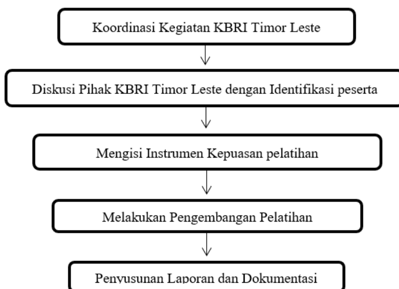
Gambar: Diagram Alur Pelaksanaan PkM

Kegiatan pengabdian kepada masyarakat ini menyasar Pekerja Migran Indonesia (PMI) yang berada di Dili, Timor Leste. Mitra kegiatan dalam program ini adalah komunitas Pekerja Migran Indonesia yang berkoordinasi dengan KBRI Dili, Timor Leste. Jumlah mitra yang terlibat sebanyak 1 mitra kelembagaan, yaitu KBRI Dili sebagai fasilitator koordinasi, serta 20 orang PMI sebagai peserta kegiatan. Kegiatan dilaksanakan di Dili, Timor Leste, selama tiga bulan, melalui kombinasi pertemuan daring dan luring. Kegiatan pengabdian ini menyasar Pekerja Migran Indonesia (PMI) yang berada di Dili, Timor Leste, dengan jumlah peserta sebanyak 20 orang. Tim pengabdian terdiri dari dosen lintas program studi Universitas Negeri Surabaya yang memiliki kompetensi di bidang etika, estetika, olahraga, dan komunikasi. Kegiatan dilaksanakan selama tiga bulan dengan kombinasi pertemuan daring dan luring.