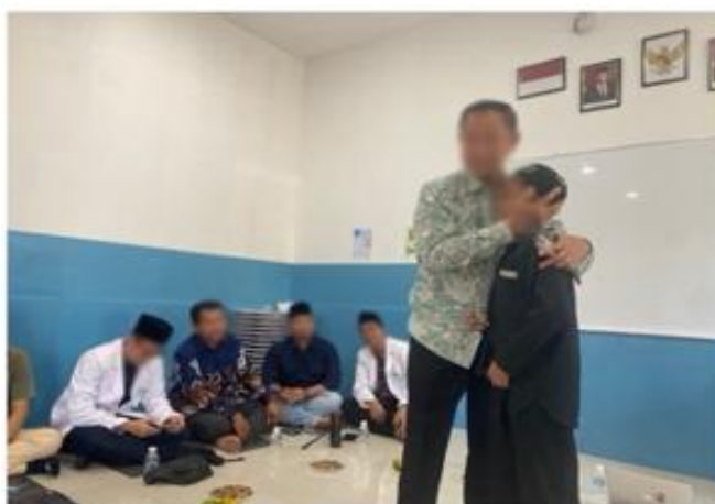
Gambar 2. Simulasi Penerapan Nilai Akhlakul Karimah Dalam Kehidupan Sehari-Hari

Pelaksanaan program pengabdian masyarakat di Sanggar Belajar Puchong, Malaysia, menghasilkan sejumlah temuan penting yang mendukung hipotesis penelitian. Secara umum, kegiatan ini memberikan kontribusi signifikan terhadap pemahaman peserta mengenai filosofi keluarga masalah , keterlibatan aktif dalam proses belajar, serta penguatan peran keluarga sebagai institusi utama pendidikan moral di lingkungan diaspora.