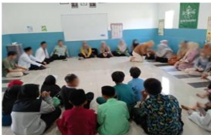
Gambar 3. Penyuluhan Yang Memaparkan Filosofi Keluarga Maslahah Sebagai Landasan Pendidikan Karakter Bagi Orangtua Dan Siswa

Dari sisi ilmiah, peningkatan pemahaman ini dapat dijelaskan melalui teori meaningful learning yang dikemukakan oleh (Ausubel, 1978). Menurut teori tersebut, pembelajaran akan lebih bermakna apabila informasi baru dikaitkan dengan pengetahuan dan pengalaman yang sudah dimiliki peserta. Dalam program ini, konsep keluarga masalahah tidak disajikan sebagai teori abstrak semata, tetapi dikaitkan langsung dengan praktik pengasuhan sehari-hari di lingkungan diaspora. Itulah sebabnya, mayoritas peserta merasa materi yang diberikan relevan (82%) dan mudah dipahami.