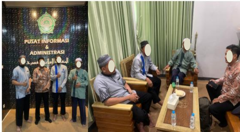
Gambar 1. Persiapan Impementasi

Secara akademis, kegiatan ini memberikan kontribusi terhadap pengembangan model sistem transaksi digital berbasis AI-IoT dan biometrik di lingkungan pendidikan Islam, yang sebelumnya masih menghadapi keterbatasan teknologi dan kepercayaan pengguna (Umam et al., 2022). Dengan tingkat keberhasilan implementasi di atas 90% dan respons positif dari seluruh pihak, sistem ini layak dijadikan model inovasi digitalisasi keuangan pesantren yang dapat direplikasi di lembaga pendidikan serupa di wilayah Sukoharjo maupun daerah lain di Indonesia.