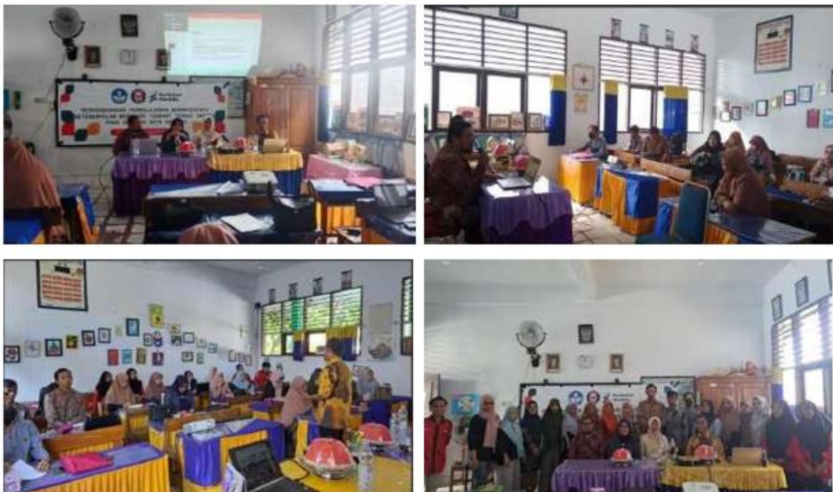
Gambar 1. Dokumentasi Foto Kegiatan di SD Negeri 25 dan 37 Kendari

Pelaksanaan pelatihan tentang pengembangan pembelajaran berorientasi pada keterampilan berpikir tingkat tinggi pada guru oleh Tim Pengabdian FKIP UHO bertempat di Ruang Kelas SD Negeri 25 Kendari. Pelatihan ini diikuti oleh 16 guru yang terdiri dari 6 orang Guru SD Negeri 25 Kendari, 8 orang Guru SD Negeri 37 Kendari, Kepala Sekolah SD Negeri 25 Kendari, dan Kepala Sekolah SD Negeri 37 Kendari.